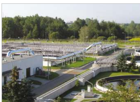
Siedlce Modernizacja oczyszczalni ścieków z suszarnią osadów ściekowych ul. Zamiejska 1