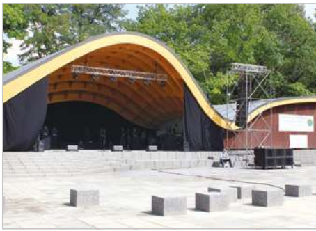
Bytom Modernizacja Amfiteatru na terenie zabytkowego Parku Miejskiego im. Franciszka Kachła ul. Wrocławska - Tarnogórska