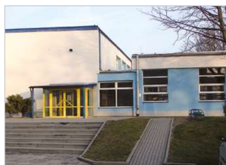
Skawina Termomodernizacja Zespołu Szkół Techniczno-Ekonomicznych ul. Kopernika 13