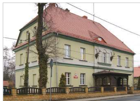
Prószków Modernizacja i rozbudowa budyneków Nadleśnictwa Prószków wraz z zagospodarowaniem terenu ul. Opolska 11