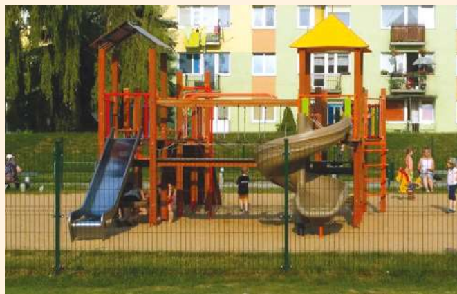
Bezpieczny plac zabaw na bydgoskim osiedlu

W Bydgoszczy od 2012 r. funkcjonuje budżet obywatelski. Mieszkańcy mają decydujący głos w sprawie inwestycji na swoich osiedlach. W 2014 roku na budowę placów zabaw i plenerowych siłowni wydano z budżetu obywatelskiego ponad milion złotych, a w 2015 roku uchwałą Rady Miasta zatwierdzono ponad milion pięćset tysięcy zł. Przykładowo w budżecie obywatelskim na rok 2015 r w Lublinie przeznaczono na podobny cel ponad 700 tys. zł., a w Rzeszowie 150 tys. zł. Tych inwestycji przybywa z każdym rokiem i na każdym osiedlu, co cieszyć powinno przede wszystkim tych najmłodszych, którzy potrzebują bezpiecznych miejsc by rozładować niespożyte pokłady energii.