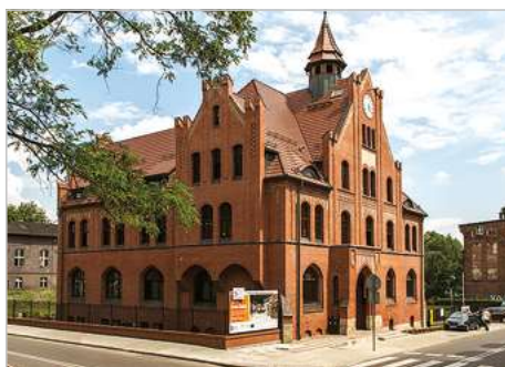
Świętochłowice Modernizacja i adaptacja budynku na Muzeum Powstań Śląskich ul. Polaka 1