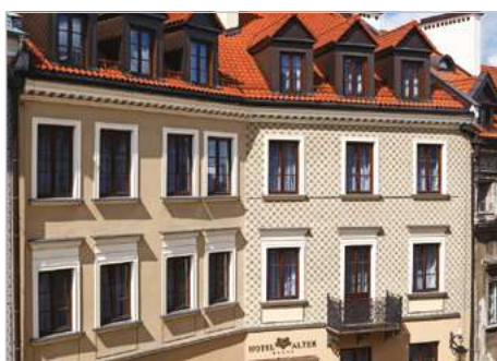
Lublin Modernizacja Hotelu ALTER ul. Grodzka 30