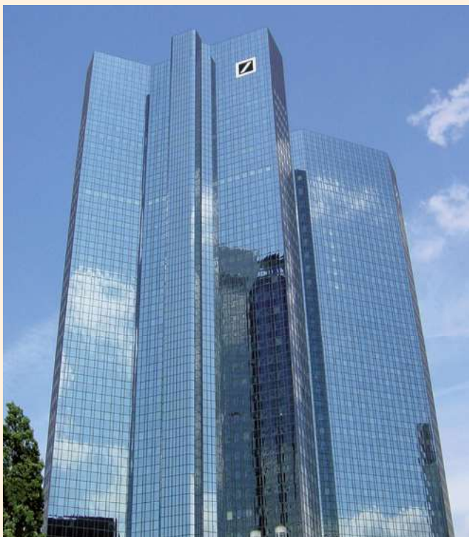
Centrala Deutsche Bank AG, Frankfurt nad Menem

Realizacja takiego podejścia, które ma pewne cechy innowacji, jest w naszym przypadku możliwa dzięki posiadającej duże doświadczenie, gruntowną wiedzę fachową i otwartej na nowe technologie, nowe materiały kadrze inżyniersko-technicznej wszystkich szczebli.