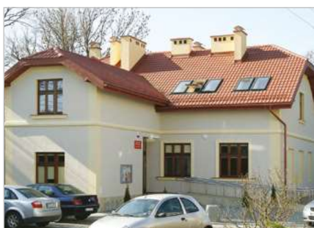
Rzeszów Modernizacja i adaptacja budynku na potrzeby kulturalno-oświatowe ul. Wieniawskiego 84