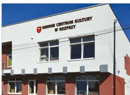
Rozprza Modernizacja i adaptacja budyńku handlowo-usługowego na Gminne Centrum Kultury ul. Kościuszki 6