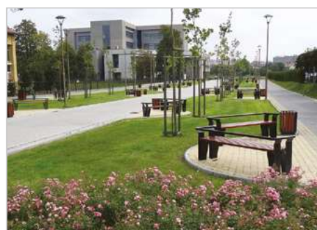
Rzeszów Modernizacja ciągu pieszego od ul. Rejtana w kierunku ul. Gen. Kustronia