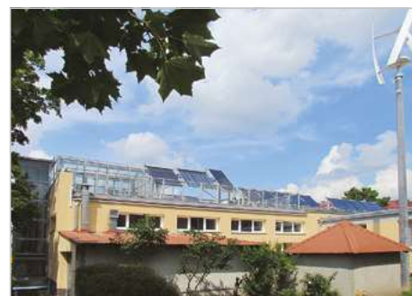
Wyszaków Modernizacja Mazowieckiego Edukacyjnego Centrum Energii Odnawialnej przy Liceum Ogólnokształcącym im. C.K. Norwida ul. 11 listopada 1