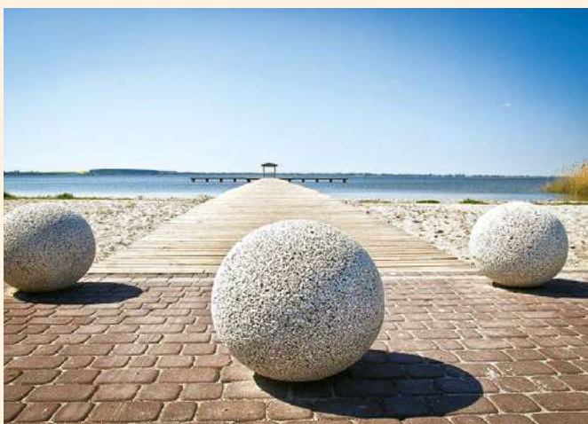
Plaża, pomost i punkt widokowy nad j. Miedwie, gmina Warnice

i cieków wodnych znajdujących się na terenie 12 gmin wchodzących w skład Stowarzyszenia oraz propagowanie ekoturystyki. Innymi słowy chodzi o to, by dzięki wsparciu unijnemu ratować to co zostało i sprawić by turyści gremialnie przybywali na odnowione plaże, zażywali kąpeli w czystych wodach województwa zachodniopomorskiego. W ramach dofinansowania ze środków UE można napotkać na ciekawe inwestycje. Jedną z nich jest np. modernizacja pokładu i platformy widokowej nad jeziorem Barlineckim. W trakcie realizacji inwestycji wymienione zostały deski, poręcze, barierki oraz słupki podtrzymujące daszki altan. Dodatkowo, oczyszczono i zabezpieczono antykorozyjnie elementy stalowe i wykonano nową nawierzchnię promenady i nowe schody. Realizacja tej modernizacji z pewnością przyczyniła się do lepszego wykorzystania walorów przyrodniczo-krajobrazowych oraz dziedzictwa historyczno-kulturowego w Barlinku. Obiekt jest dostępny dla osób niepełnosprawnych. Sąsiedztwo z obiektami gastronomicznymi, hotelem, pensjonatem oraz kompletność z innymi projektami realizowanymi przez gminę, dodatkowo wzmacnia jego funkcję jako infrastruktury turystycznej. Jezioro Barlineckie jest włączone do sieci Natura 2000. Rewitalizacja tego miejsca już przynosi wymierne efekty, ponieważ odnotowano znaczny rozwój ruchu turystycznego. Położenie obiektu sprawia, że cieszy się on wielką popularnością wśród mieszkańców i turystów. Całkowity koszt realizacji projektu 163 259,52 zł (Kwota dofinansowania: 138 770,59 zł)