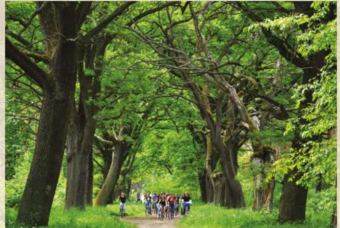
Aleja dębowa – fragment ścieżki przyrodniczej Karłów – Wałkowa - Karłów

Ze względu na niepowtarzalne walory milickich lasów, na terenie Nadleśnictwa Milicz utworzono Leśny Kompleks Promocyjny „Lasy Doliny Baryczy” - specjalną jednostką organizacyjną Lasów Państwowych wspierającą edukację leśną społeczeństwa, promocję lasów, badania naukowe i wdrażanie nowych technologii. Jest to jedna z 25 tego typu jednostek w Polsce.