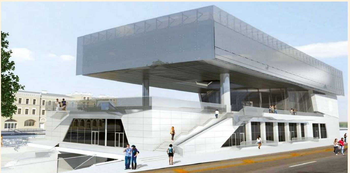
Nowa-stara Bydgoszcz Główna

W ciągu ostatnich kilkudziesięciu miesięcy w Polsce zmodernizowano 67 dworców za ponad miliard złotych. Sięgnijmy po przykłady.