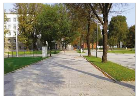
Gliwice Modernizacja ul. Akademickiej oraz terenów przyległych jako publicznej strefy pieszej