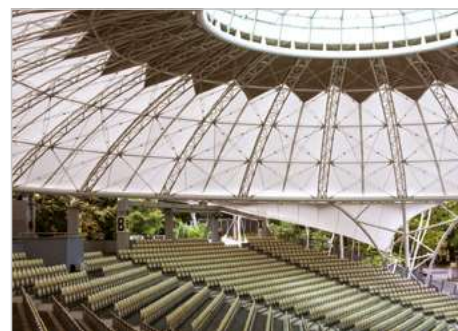
Swinoujście Modernizacja amfiteatru miejskiego, zadaszenie trybun widowni amfiteatru im. Marka Grechuty ul. Fryderyka Chopina 30