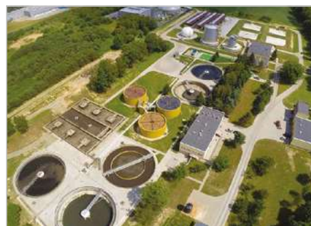
Żydomice gm. Rawa Mazowiecka Modernizacja miejskiej oczyszczalni ścieków dla miasta Rawa Mazowiecka Żydomice