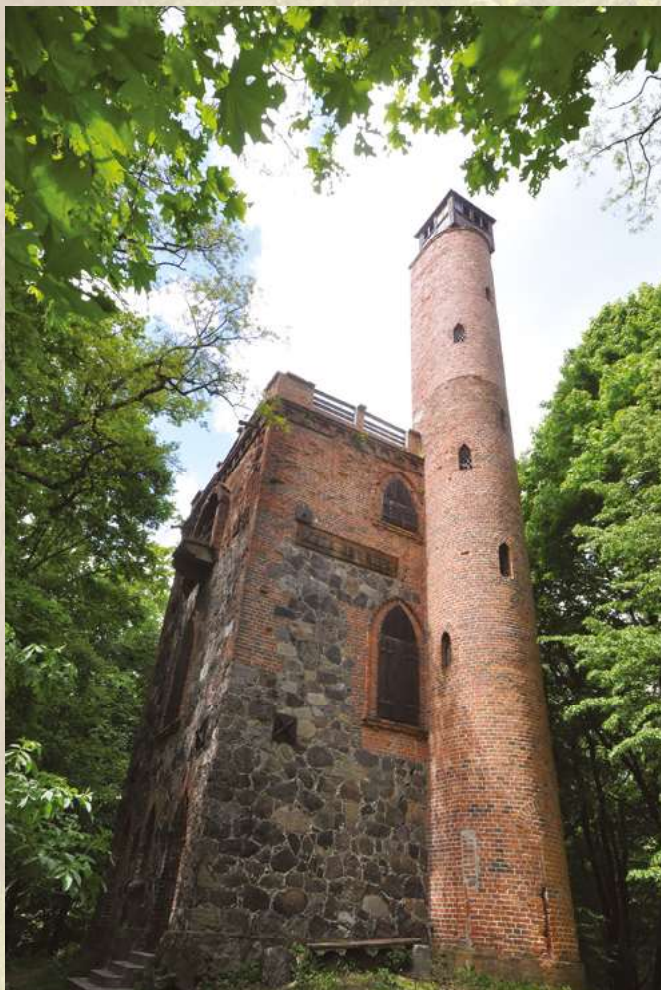
Wieża Odyniec w Rezerwacie Przyrody „Wzgórze Joanny”

Wirtualna wycieczka po Nadleśnictwie Milicz http://www.lasonline.pl/milicz.html