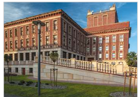
Dąbrowa Górnicza Modernizacja Pałacu Kultury Zagłębia ul. Plac Wolności 1