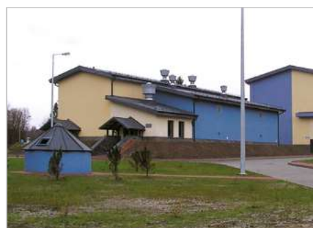
Sanok Modernizacja Stacji Uzdatniania Wody w Trepczy ul. Sanocka 68