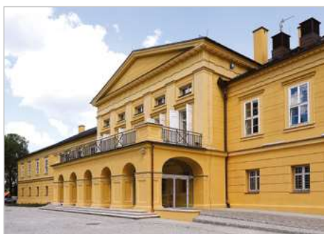
Koszęcin „Rewitalizacja Zespołu Pałacowo - Parkowego w ramach tworzenia Śląskiego Centrum Edukacji Regionalnej”, ul. Zamkowa 3