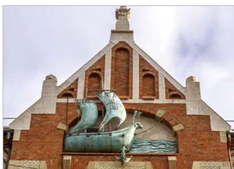
Kraków Remont konserwatorski elewacji budynku „Dom pod Globusem” Siedziba Wydawnictwa Literackiego ul. Długa 1