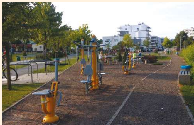
Plenerowa siłownia fitness wybudowana z inicjatywy SM Budowlani w Bydgoszczy

W Polsce nowe place zabaw powstają z różnych środków. Część z nich powstaje ze środków Unii Europejskiej w ramach RPO - Rewitalizacja zdegradowanych dzielnic miast. Przykładem takim może być Bydgoszcz (woj. kujawsko-pomorskie). Tu w ramach projektu Wyspa Młyńska III etap – budowa infrastruktury rekreacyjnej Wyspy Młyńskiej i jej najbliższego otoczenia wybudowano m.in. nowoczesny plac zabaw. (wartość projektu 26491342,45 PLN, wysokość dofinansowania 16046062,77 PLN). Również w ramach tego projektu powstała jedna z pierwszych w mieście plenerowych siłowni fitness przy ul. Ogrody. Pomysłodawcą był Zarząd Spółdzielni Mieszkaniowej „Budowlani” (dotacja pośrednia ok. 719.000 zł)