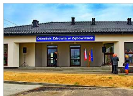
Zębowice Modernizacja Ośrodka Zdrowia ul. Izydora Murka 3a