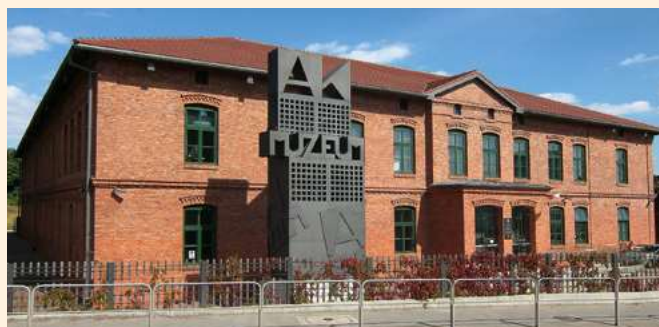
Muzeum AK w Krakowie

rozpoznawczym jest słowo, wyraz, czy też pojęcie: „Chemobudowa”. Dziś działamy pod nazwą Chemobudowa-Kraków S.A. i jesteśmy w całości, dokładnie w 100% własnością Skarbu Państwa, co jest swoistym ewenementem, który w naszym przypadku dowodzi, że to co „Państwowe” nie musi być złe, bo ciągle działamy, budujemy trudne w realizacji obiekty, w tempie dostosowanym do wymagań i oczekiwań inwestorów, którzy nam zaufali i powierzyli do wykonania obiekty będące głównymi elementami realizowanych inwestycji.