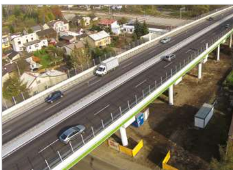
Dąbrowa Górnicza Modernizacja drogi krajowej nr 94 na terenie miasta Dąbrowa Górnicza