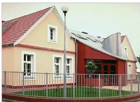
Poniec Modernizacja i adaptacja budyneków poszpitalnych na Przedszkole Samorządowe ul. Kościuszki 7