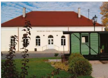
Czyżew Modernizacja Muzeum Ziemi Czyżewskiej ul. Kolejowa 13