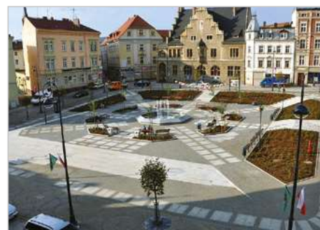
Wałbrzych Modernizacja i renowacja placów w obrębie Śródmieścia Plac Magistracki