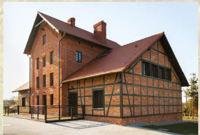
Dom Drzewa – Centrum Edukacji Ekologicznej fot.www.unframe.pl

W tym roku Nadleśnictwo Milicz zakończyło adaptację zabytkowej wyluszczeni szyszek we wsi Wałkowa na Ośrodek Edukacji Przyrodniczej „Dom Drzewa”. Obiekt jest jednym z punktów na trasie ścieżki przyrodniczo-leśnej Karłów – Wałkowa - Karłów, która dostosowana jest również dla osób niepełnosprawnych.