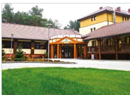
Swolszewice Małe - Smardzewice Modernizacja Leśnego Ośrodka Szkoleniowego „Nagórzyce” ul. Leśna 1