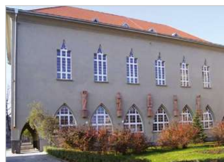
Zabrze Termomodernizacja Zespołu Szkół Ogólnokształcących ul. Wolności 323