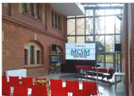
Toruń Adaptacja Młynów Toruńskich na Międzynarodowe Centrum Spotkań Młodzieży ul. Łokietka 3