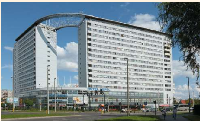
Budynek mieszkalno-usługowy „Dom wschodzącego słońca” w Krakowie

Do tegorocznej, XIX edycji Konkursu Modernizacja Roku 2014 zgłosiliśmy wykonany przez nas obiekt będący nową siedzibą Ośrodka Dokumentacji Sztuki Tadeusza Kantora Cricoteka i Muzeum Tadeusza Kantora przy ul. Nadwiślańskiej 2-4 w Krakowie. Obiekt ten stanowi podręcznikowy przykład innowacyjnego i wizjonerskiego projektu, który przybrał postać materialną dzięki wysiłkowi bardzo wielu naszych pracowników stanowiących kadre inżynieryjno-techniczną, a także pracowników produkcyjnych reprezentujących całą paletę różnych zawodów budowlanych. W tym miejscu nie sposób pominąć szeregu firm specjalistycznych, które włączyliśmy do współpracy przy realizacji tego obiektu i wniosły swój niemały wkład w uzyskany efekt końcowy.