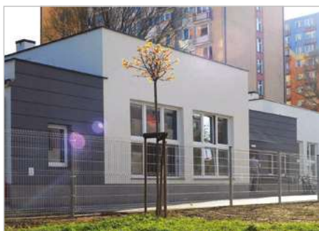
Zielona Góra Modernizacja i adaptacja byłej kotłowni na Dzienny Ośrodek Młodzieżowy ul. Władysława IV 10