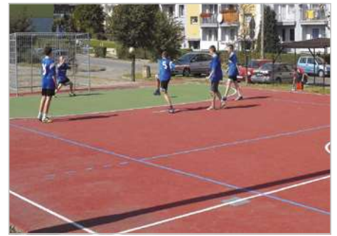
Bytom Modernizacja boiska wielofunkcyjnego ul. Adamka