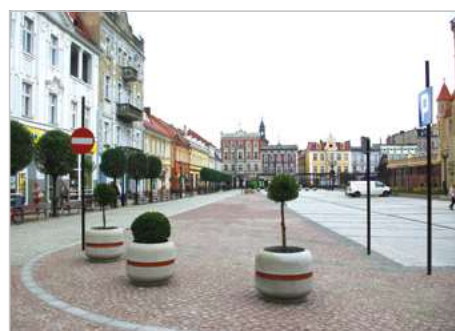
Krotoszyn Rewitalizacja centrum miasta Krotoszyna