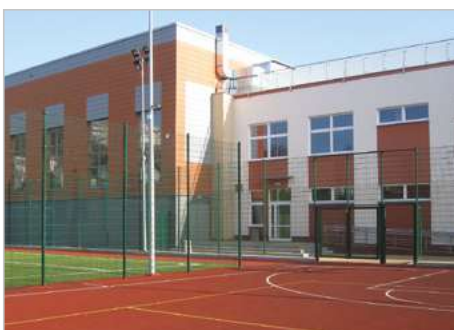
Gdynia Modernizacja i rozbudowa Szkoły Podstawowej nr 6 wraz z infrastrukturą ul. Cechowa 22