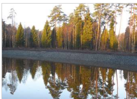
Zawadzkie Renowacja - zbiornik małej retencji w oddziale 22 m Leśnictwo Jaźwin Nadleśnictwo Zawadzkie