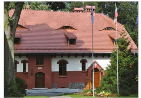
Czarnków Modernizacja budynku Nadleśnictwa Sarbia Sarbką 46