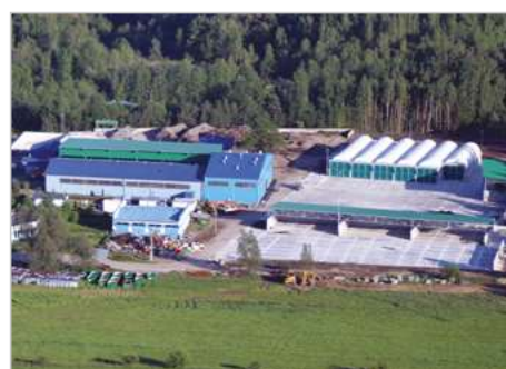
Lubań Modernizacja Centrum Utylizacji Odpadów Gmin Łużyckich ul. Bazaltowa 1