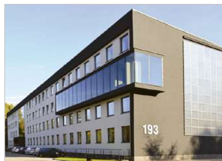
Katowice Modernizacja budynku biurowo-administracyjnego TMC 2 Al. Korfantego 193