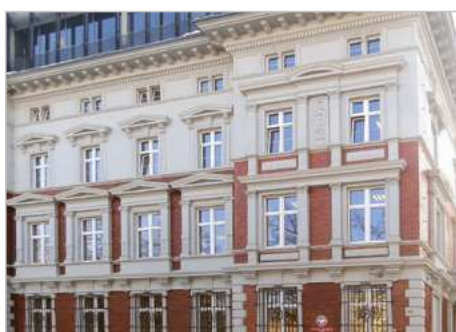
Zabrze Modernizacja, rozbudowa i adaptacja budynku na Powiatowy Urząd Pracy Plac Krakowski 9