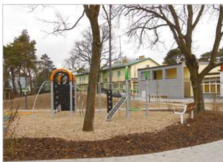
Józefów Modernizacja skweru im. Św. Jana Pawła II wraz z budynkiem Miejskiego Ośrodka Kultury ul. Kard. Wyszyńskiego 1