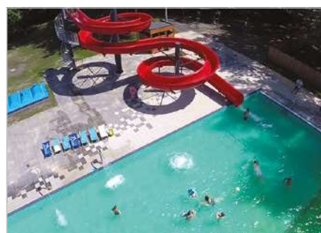
Świętochłowice Rewitalizacja kąpieliska miejskiego na terenie OSiR „Skałka” Aleja Parkowa 15