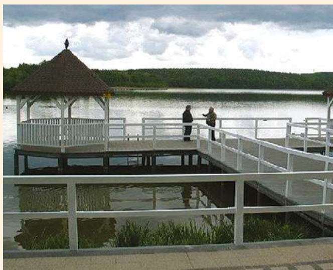
Gmina Barlinek, Pomost w Barlinku

Ach jak przyjemnie kołysać się wśród fal gdy... woda czysta i plaża ładna! Polska to kraj usłany jeziorami, rzekami, terenami które stworzone są do wypoczynku. Cóż z tego, że wiele tych miejsc zatraciło dawną swą świetność. Po latach prosperity ośrodków zakładowych, w których dzielnie spędzała wakacje cała załoga, pływając na rowerach wodnych, kajakach, na dwie zmiany zapożyczając stołówkę, a wieczorami bawiąc się na wieczorkach zapoznawczych - wiele takich miejsc uległo degradacji i zniszczeniu. Dziś, na nowo odkrywamy zalety wypoczynku na świeżym powietrzu rozpoczynając mozolną walkę z połamanymi pomostami, ławeczkami, stertą śmieci na plażach i w wodzie.