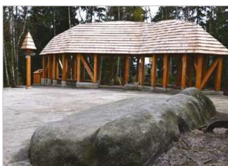
Kudowa Zdrój Infrastruktura turystyczna na obszarze Błędnych Skał w Parku Narodowym Gór Stołowych