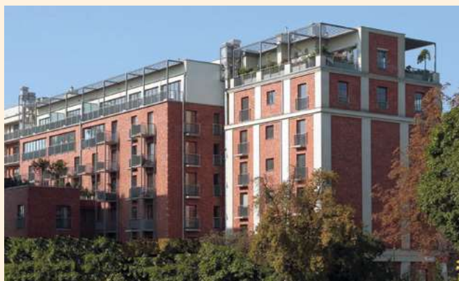
Adaptacja i rozbudowa budynku Młyna nr 2 na lofty w Krakowie

Pomimo tych 65 lat mamy wolę dalszego działania, wolę uczenia się i zdobywania coraz to nowych doświadczeń, czasami bolesnych, okupionych wytężoną pracą, a także kosztujących co nieco. Mając na uwadze wieloletnią tradycję, o której mówimy i myślimy że: „tradycja zobowiązuje”, mając na uwadze, że jesteśmy stale oceniani przez naszych zleceniodawców, mając świadomość, że od bieżących efektów naszego działania zależy przyszłość Przedsiębiorstwa, staramy się, aby wszystko co robimy było wykonane dobrze, rzetelnie zgodnie z aktualną wiedzą w dziedzinie budownictwa, po prostu najlepiej jak potrafimy.