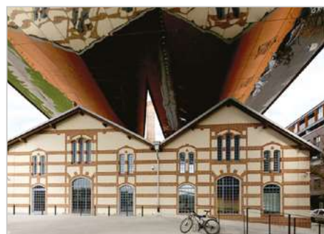
Kraków Modernizacja Ośrodka Dokumentacji Sztuki Tadeusza Kantora CRICOTEKA ul. Nadwiślańska 2-4