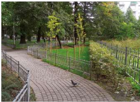
Chorzów Rewaloryzacja Parku Hutników ul. Gen. H. Dąbrowskiego