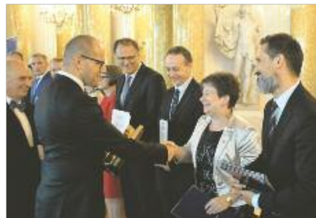
♦ Kategoria: Obiekt mieszkalne. Nagroda dla Szczecińskiego Towarzystwa Budownictwa Społecznego Sp. z o.o. za rewitalizację RAZEM – Rewitalizacja wnętrza kwartału 23 ograniczonego ulicami Bohaterów Getta Warszawskiego, Królowej Jadwigi i Aleją Wojska Polskiego – Szczecin.