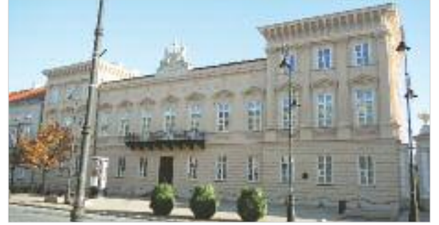
Dzięki rewitalizacji pałac doprowadzony został do standardu