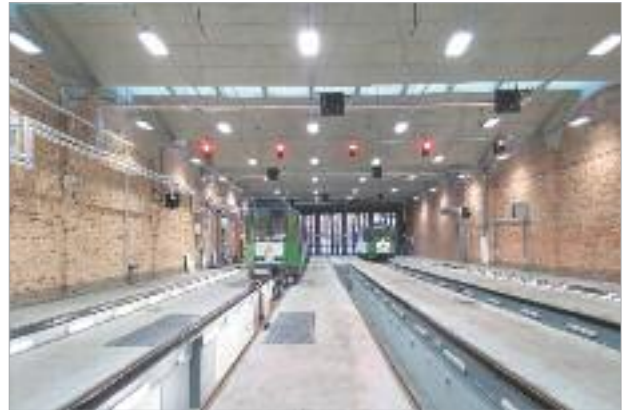
♦ Zajezdnia Pogodno w Szczecinie

TRAMWAJE I KOLEJ | Grupa ZUE zgłosiła do konkursu dwie inwestycje – przebudowę obiektów zajezdni Pogodno w Szczecinie oraz wykonanie robót budowlanych w ramach projektu polepszenia jakości usług przewozowych poprzez poprawę stanu technicznego linii kolejowych na odcinkach Zawiercie-Dąbrowa Górnica i Ząbkowice-Jaworzno Szczakowa.