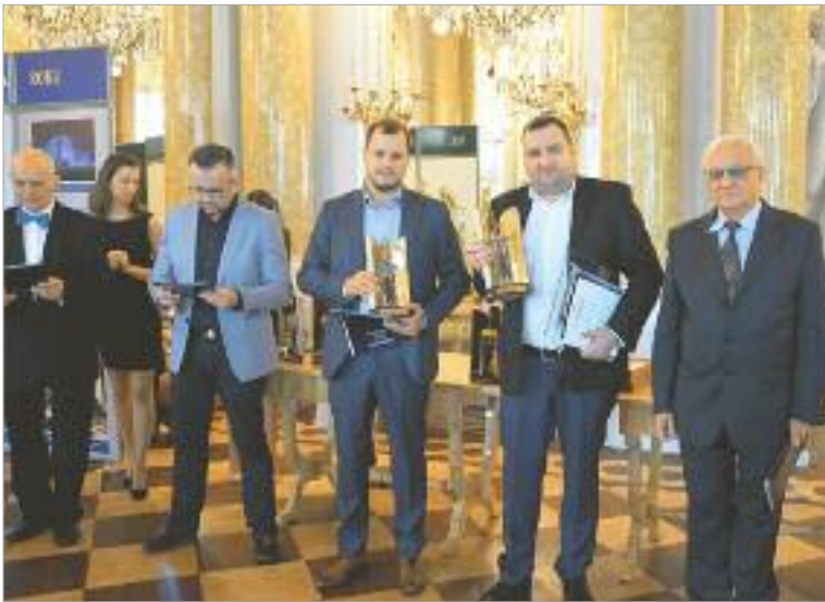
← Kategoria: Obiekty przemysłowo-inżynierskie. Nagroda dla Energopol Szczecin SA za modernizację toru wodnego Świnoujście – Szczecin (Kanał Piastowski i Mielński).