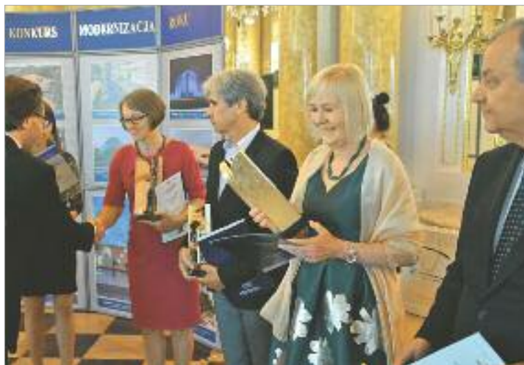
← Kategoria: Obiekty użyteczności publicznej. Nagroda dla Komunalnego Zakładu Gospodarki Mieszkaniowej w Katowicach za modernizację, rozbudowę i adaptację budynku mieszkalnego na usługowo-biurowy, ul. św. Jana 10 – Katowice.