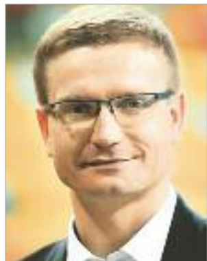
KRZYSZTOF MATYJASZCZYK prezydent Częstochowy

Modernizacja to jedno z kluczowych słów w samorządowej nomenklaturze, dlatego tytuł Modernizacja Roku brzmi dla samorządowców zachęcająco.