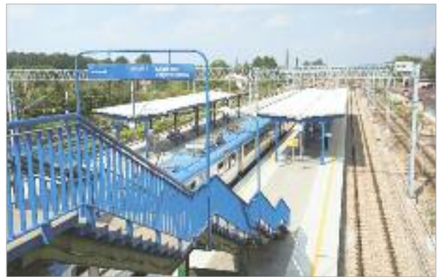
♦ Zmodernizowana linia kolejowa

Modernizację zajezdni prowadzone w formule „Zaprojektuj i wybuduj”. Zaprojektowanie obiektu odbyło się w oparciu o program funkcjonalno-użytkowy przygotowany przez zamawiającego.