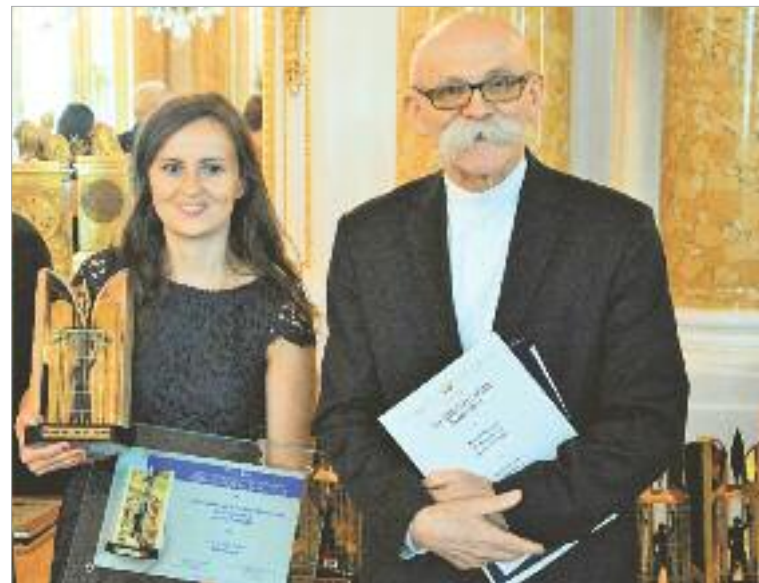
← Kategoria: Obiekty hotelarsko-turystyczne. Nagroda dla Arche Sp. z o.o. Warszawa za modernizację Zamku Biskupiego przy ul. Zamkowej 1 w Janowie Podlaskim.