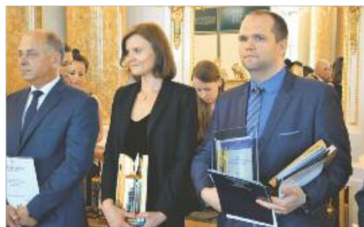
← Kategoria: Obiekty ochrony środowiska. Nagroda dla MPWiK we Wrocławiu za przebudowę budynku technologicznego, chemicznego pod budowę Stacji badawczej na terenie ZPW Mokry Dwór, ul. Na Grobli 14-16 we Wrocławiu.