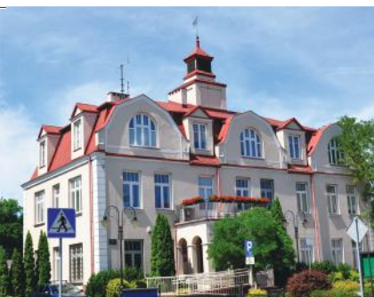
Urząd Gminy Brwinów, siedziba władz gminy miejsko-wiejskiej liczącej ok. 25 tys. mieszkańców.