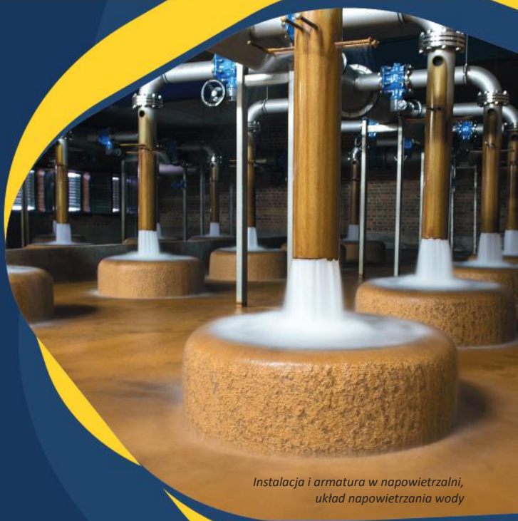
Instalacja i armatura w napowietrzalni, układ napowietrzania wody

Ciągła i bezawaryjna, bez względu na porę dnia i roku, dostawa wody i odbiór ścieków.