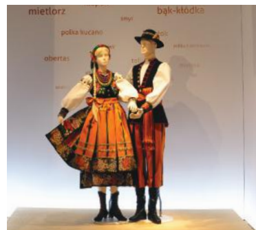
Siedziba zespołu „Mazowsze” i Centrum Folkloru Polskiego w Otrębusach są na terenie gminy Brwinów.