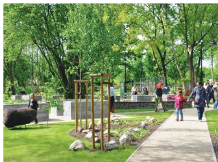
Ogród botaniczny założony w 2020 r. inspirowany do tworzenia własnych ogrodów i jest miejscem edukacji ekologicznej.